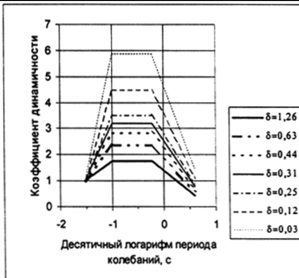
Рис.П.3.1. Спектры коэффициентов динамичности для различных логарифмических декрементов колебаний \delta